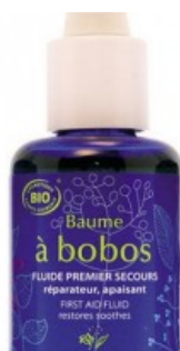
Baume à bobos